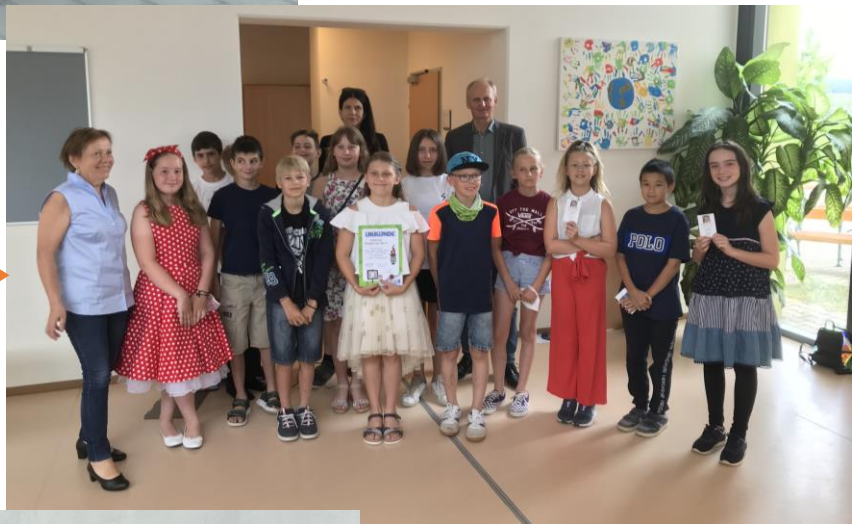
Verabschiedung der 4. Klasse! Alles Gute!