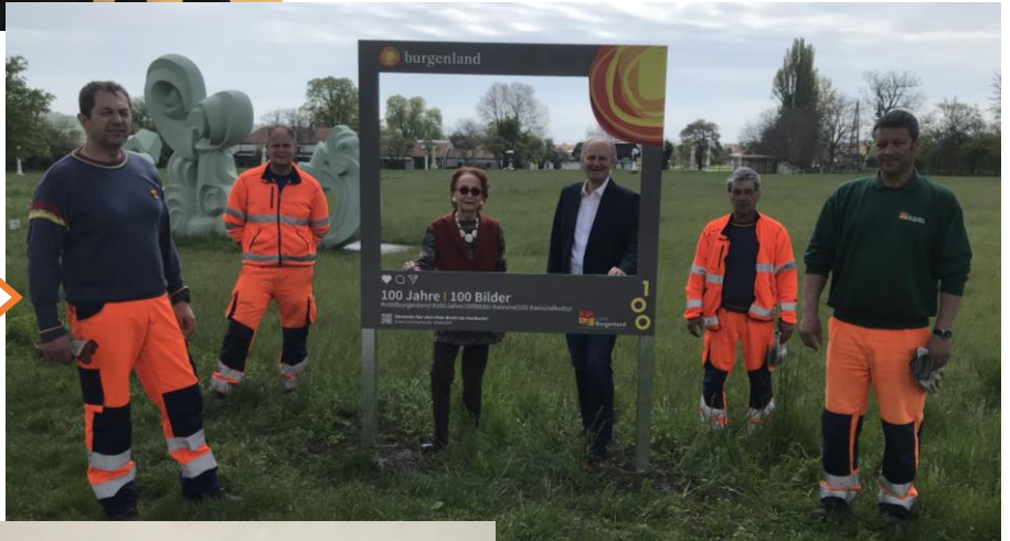
100 Schätze – 100 Plätze Jubiläum 100 Jahre Burgenland. Fototafel bei Freilichtmuseum Wander Bertoni!