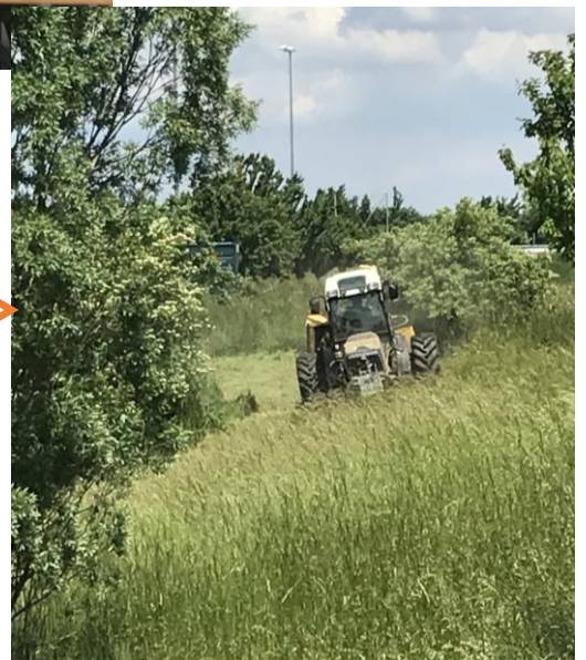
Grünraumpflege am Rückhaltebecken!