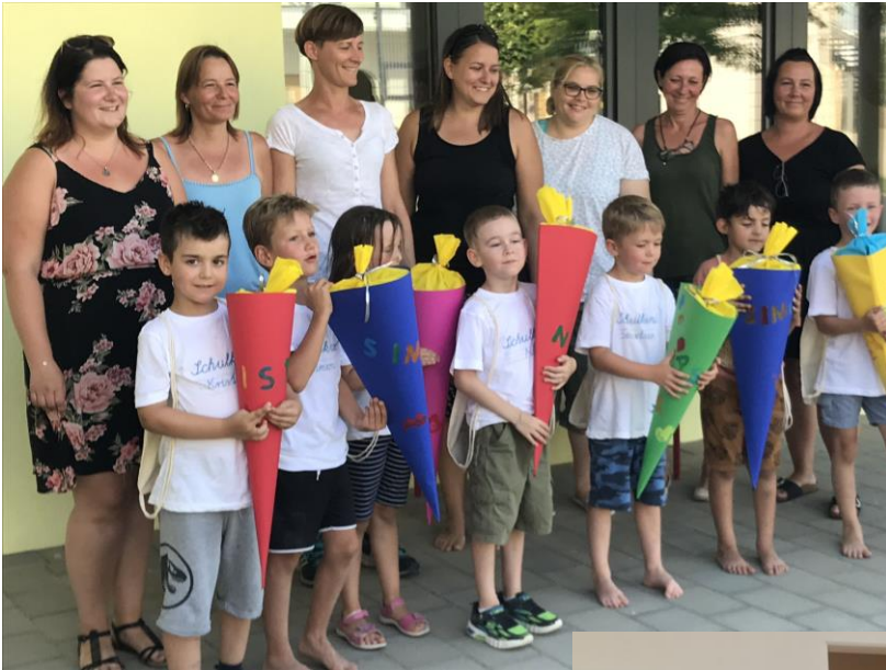
Kindergarten: „Rauswurf der Großen“! Alles Gute für den Schulstart!