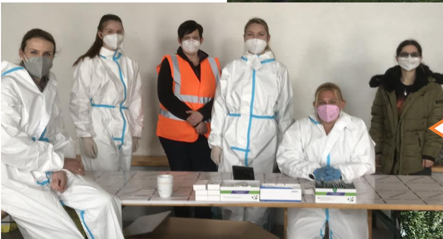
Einige fleißige Helferlein der Covid-19 Teststraße! Danke!