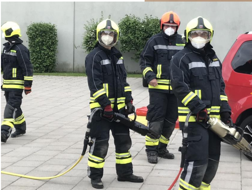
Feuerwehrenspeizung unter Covid-19 Maßnahmen!