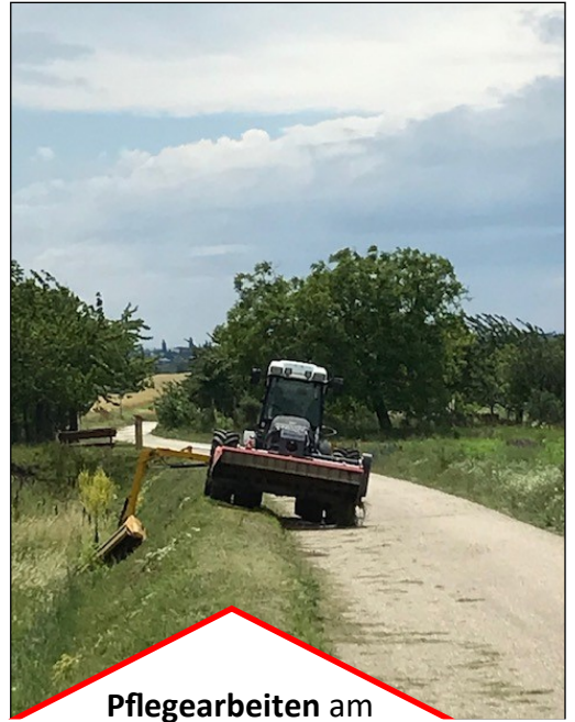
Pflegearbeiten am Rückhaltebecken