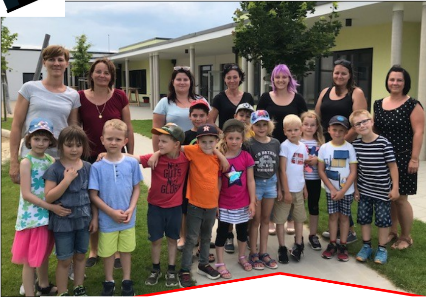
Alles Gute für den Schulstart!!!