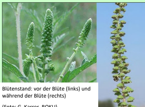
Blütenstand: vor der Blüte (links) und während der Blüte (rechts)

Eine einzige Pflanze kann bis zu 8 Milliarden Pollen verbreiten, wobei schon wenige Pollen pro m 3 Luft allergische Reaktionen auslösen können. In der Landwirtschaft stellt Ragweed wegen der schwierigen Bekämpfung und der Ertragseinbußen in einigen Ackerkulturen ein Problemunkraut dar. Weitere Infos zu Ragweed finden Sie auf www.ragweedfinder.at